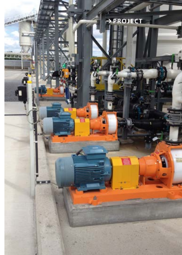
De Munsch-pompen scoren sterk door hun corrosie- en abrasiebestendigheid.

BOWI Pumps & Levels verdeelt ook de oplossingen van Steimel. "Dit zijn tandwielpompen die geschikt zijn voor het verpompen van hoogviskeuze vloeistoffen zoals olie, verf, bi-